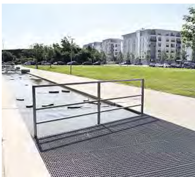
... und beim Blick aus dem Innenhof auf den City Park ...