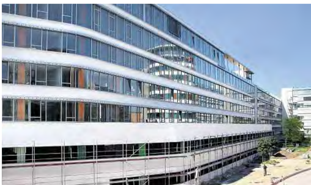
Reizvolle Eindrücke vermittelt der Neubau der PSD Bank aus dieser Perspektive ...