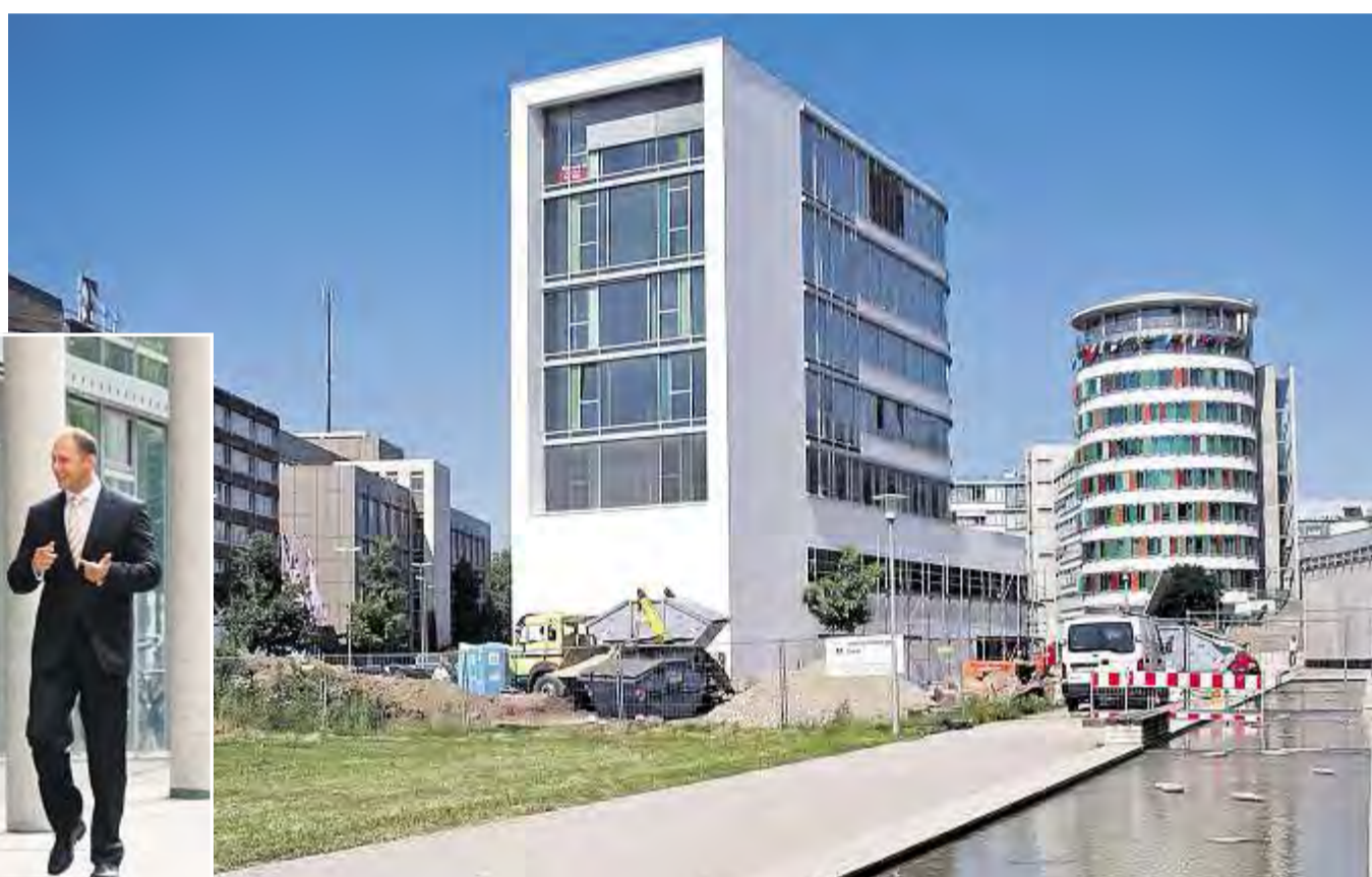
Turmbau zu Karlsruhe: Das runde Bestandsgebäude der PSD Bank ist ebenso ein Hingucker wie der Anbau.