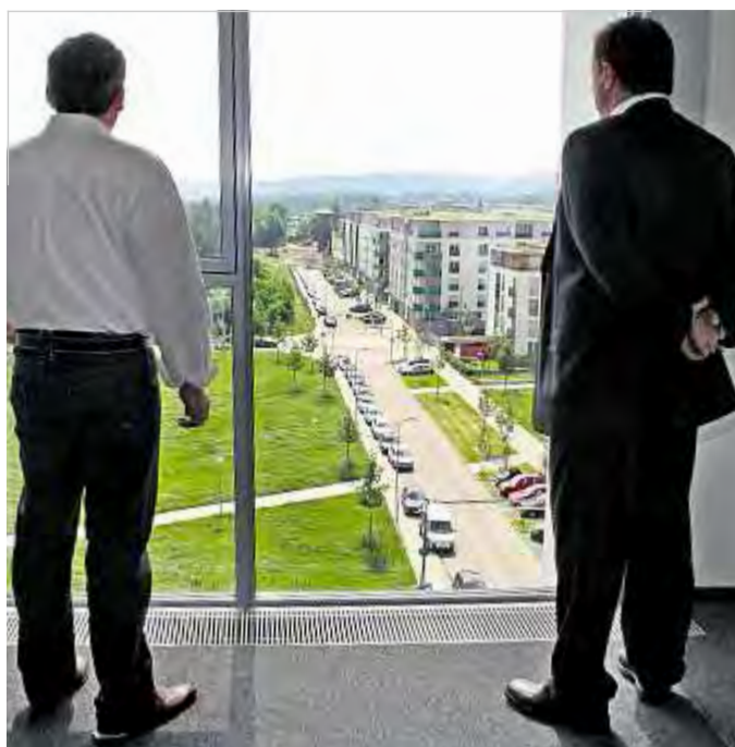
Den Überblick haben die PSD Banker nicht nur in Finanzfragen, sondern auch über den City Park.

2003 wurde eine Stiftung zur nachhaltigen und langfristigen Unterstützung sozialer Projekte gegründet