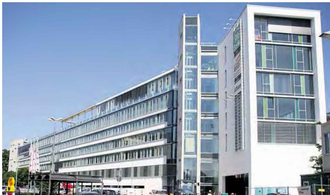
PSD Bank soweit das Auge reicht: Zehn Millionen wurden für den repräsentativen Anbau investiert.